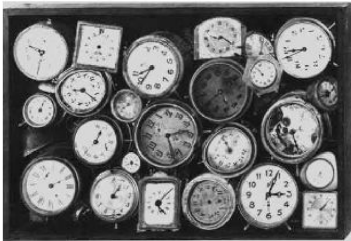
Afbeelding 5: Arman, 'Paradox du temps', 1960