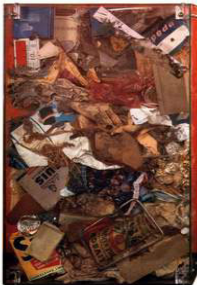
Afbeelding 6: Arman, 'Poubelle I', 1960

In de collectie van Andy Warhol was opgenomen een 'Poubelle'. De kunstenaar Arman (Nice, 1928-2005) creëerde 'Poubelles' die bestaan uit zijn afval in een plexiglazen bak. Het afval wordt door het tentoonstellen ervan in een doorzichtige bak uit zijn eigen functie ontheven en krijgt een nieuwe functie in een andere context. Dit werk moet gezien worden in relatie tot voorgaande werken waar Arman selecteert uit materiaal. Het werk 'Paradox du temps' laat eenzelfde soort constructie zien maar hier heeft Arman een selectie gemaakt van objecten. De klokken moeten verzameld zijn speciaal voor dit werk maar door hun aantal