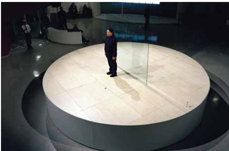
Afbeelding 7: Marina Abramovic, 'Seven easy pieces, Bruce Neumann: Body Pressure', Guggenheim museum New York, 9 november 2005

In november 2005 heropvoerde kunstenaar Marina Abramovic (Belgrado 1946) zeven performances in het Guggenheim museum in New York. Deze werken zijn oorspronkelijk in de jaren '60 en '70 uitgevoerd door verschillende kunstenaars waarvan twee werken eerder door Abramovic zelf. Dit project schenkt aandacht aan de problematiek van de weinige documentatie die bewaard is van performances uit die periode. Slechts getuigenverklaringen en foto's konden gebruikt worden voor de recreatie van de werken. De heropvoeringen zijn gefilmd door Babette Mongolte die zich sinds de jaren '70 bezighoudt met het fotograferen van performances.