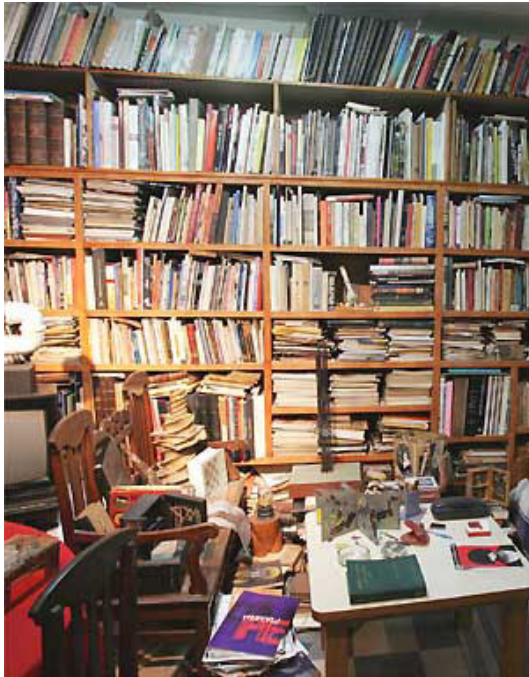
Afbeelding 3: Paulo Bruscky, archief van de kunstenaar in Recife, Brazil, 2004

In 2004 werd de 26 ste Sao Paulo Biënnale gehouden waar acht speciale kunstenaarskamers getoond werden. Een van deze kamers was een recreatie van het huis van de kunstenaar Paulo Bruscky (Pernambuco, Brazilië, 1949). Bruscky heeft een groot archief aan beeldmateriaal aangelegd waaronder een van de grootste verzamelingen met objecten van de Mail Art International Movement waar hij zich in 1973 bij aansloot. Het archief was toegankelijk voor kunstenaars en onderzoekers. Deze verzameling werd op de biënnale gelijk getoond aan de oorspronkelijke opstelling in het huis van de kunstenaar.