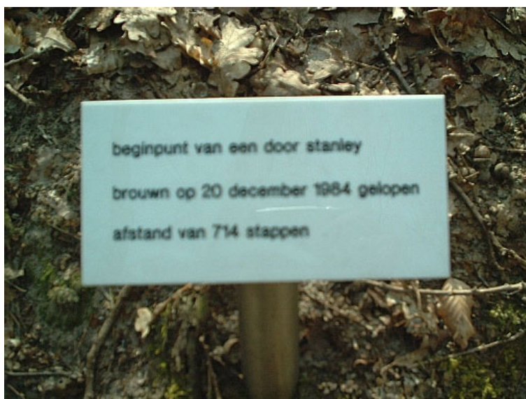
Afbeelding 2: Stanley Brouwn, z.t., Museum Kröller Müller, 1984

voor de bezoeker onbruikbaar omdat zij alleen de werken mag bekijken en niet gebruiken. De informatie van de stukken is niet te controleren en we moeten de ‘waarheid’ van het werk aannemen op basis van hun voorkomen. De esthetisering van het document verhindert de informatieoverdracht maar vertelt wel het verhaal van Brouwn.